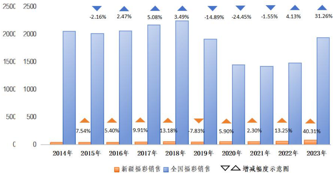
图 1－福利彩票销售规模图

在党中央及国务院、各级民政部门、财政部门的领导下，在社会各界的大力支持和公众的积极参与下，全国福利彩票实现了从无到有、从小到大、由弱到强的发展，截