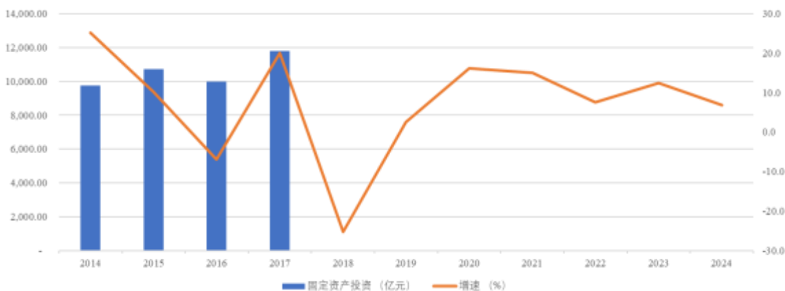
图表 2 · 新疆固定资产投资情况

注：2018年起，新疆未披露固定资产投资额的绝对值 资料来源：新疆各年度国民经济和社会发展统计公报